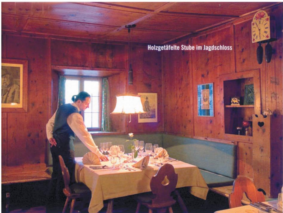
Holzgetäfelte Stube im Jagdschloss