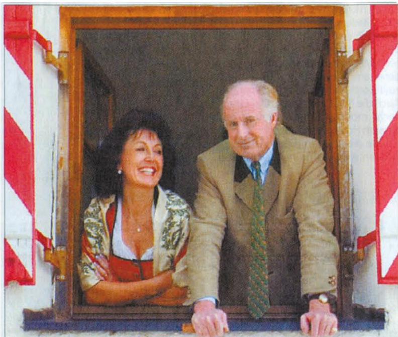
Das Ehepaar zu Stolberg-Stolberg bewirtschaftet das Jagdschloss Kühtai.

kleinen Hauch der großen K.u.K-Zeiten spüren.