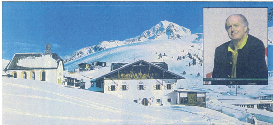
Das Jagdschloss und der Schlossherr: Graf Stollberg-Stollberg kümmert sich persönlich um die Gäste.

„Als Schlossherr ist es für mich eine ehrenvolle Verpflichtung, die Jahrzehnte alte Tradition großzügig gelebt und herzlicher Gastfreundschaft zu pflegen“, betont Graf Christian zu Stolberg-Stolberg. Im Jagdschloss stehen Beständigkeit und Echtheit im Vordergrund: Man wohnt in heimeligen Fürsten- und