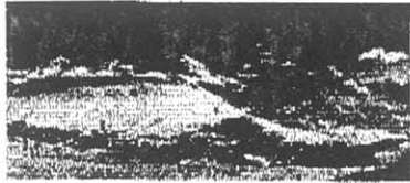
Höchster Skiort ohne Gletscher: Jede Menge Schnee bis in den Frühling hinein

Einst der Jagdsitz von Kaisern und Grafen ist Kühtal Österreichs höchster Skiort ohne Gletscher. In dem kleinen Gebiet wird Genuss-Skifahren groß geschrieben, Tourenläufer können auf 30 Routen das Sellraintal entdecken und Snowboarder im Fun Park ihren Mut testen.