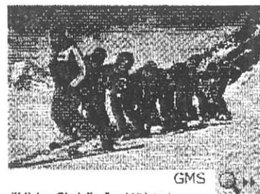
"Kids-Club": In Kühtal wird der Nachwuchs gut umsorgt

Für die wachsende Schar der Snowboarder wurde der "Fun Park Hohe Mut" angelegt. Fun-Sportgeräte wie Snow Fox, Snow Bike, Monoski und Firngleiter bieten Abwechslung vom Pistenalltag. Für Skifahrer, die gerne an ihre Grenzen gehen, bietet die örtliche Skischule ein