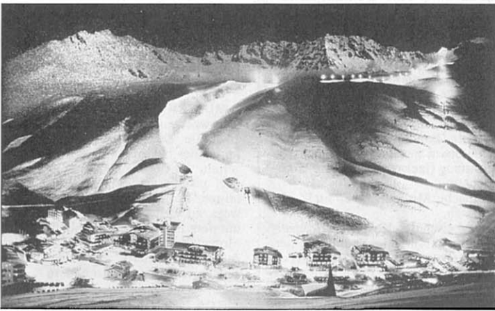
Zweimal pro Woche gibt es in Kühtai die Möglichkeit des Nachtskilaufs. Dann dauert die Schicht von Karl Braxmauer noch länger.